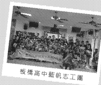
板橋高中藍帆志工團