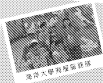
海洋大學海雁服務隊