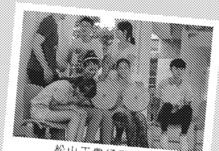
松山工農打擊樂團