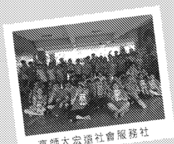
高師大宏遠社會服務社