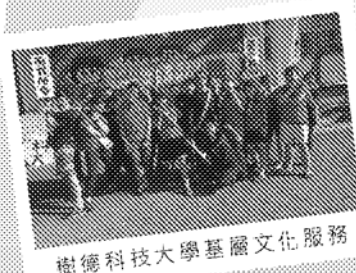
樹德科技大學基層文化服務