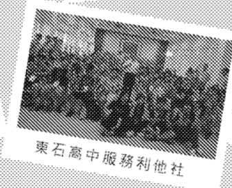
東石高中服務利他社